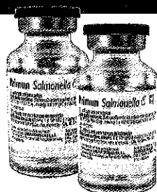
Primun Salmonella E