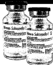
Primun Salmonella E